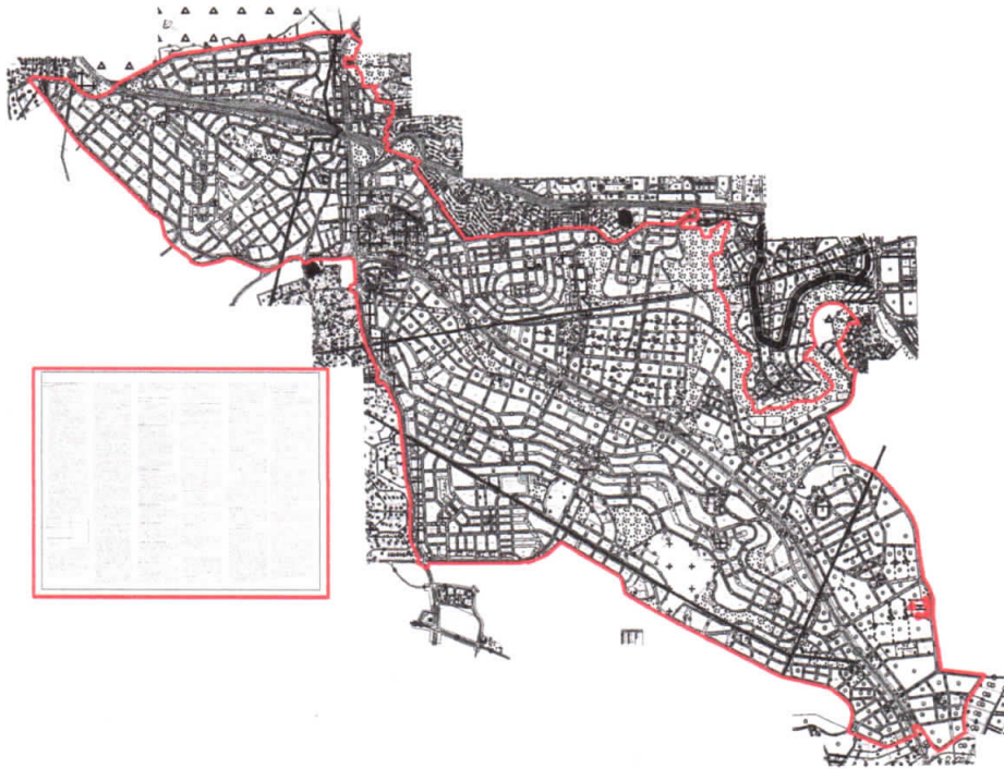
Şekil 2: Planlama Alanı Mevcut 1/1000 Uygulama İmar Planı

Planlama alanı yürürlükteki 1/1000 ölçekli uygulama imar planında gelişme konut alanları, kentsel çalışma, sosyal altyapı ve açık ve yeşil alan olarak görülmektedir.