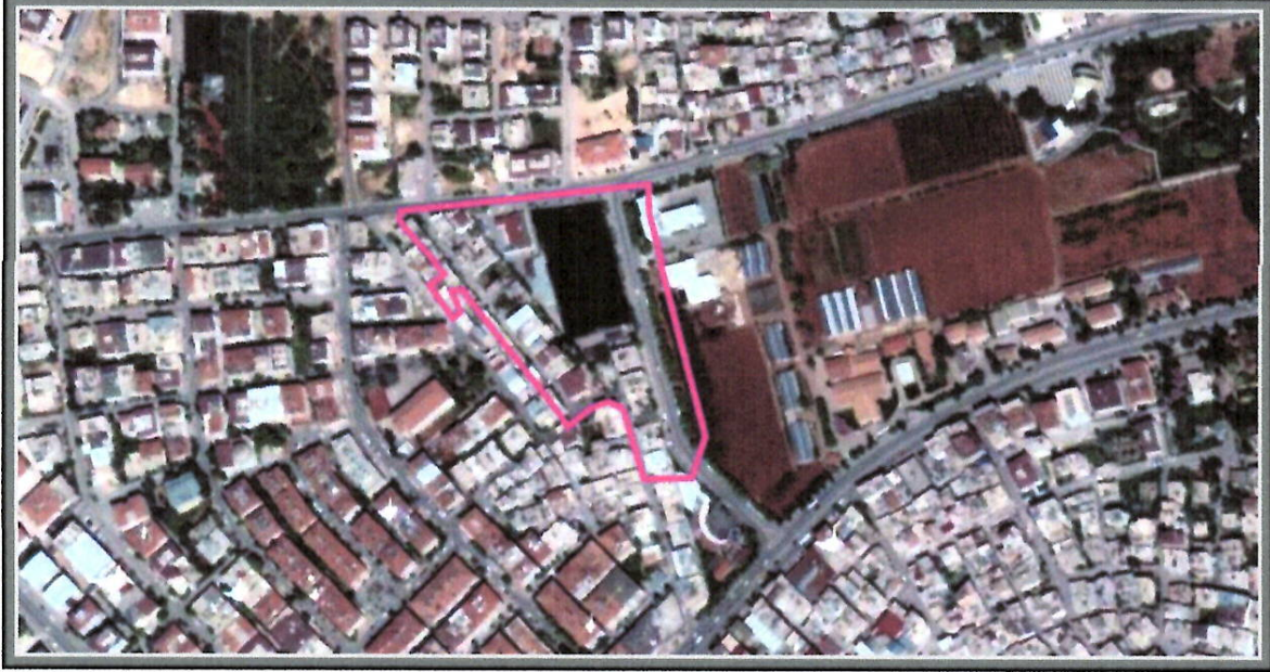
Şekil_1: Planlama alanının konumu.

İlimiz Şahinbey ilçesi, Binevler mahallesi sınırları içerisinde 1/1000 ölçekli N38-C-17-C-3-A, N38-C-17-C-3-D, N38-C-17-C-4-B ve N38-C-17-C-4-C uygulama imar paftalarında yer alan planlama alanı Fıstık Araştırma Enstitüsünün batısında yer alan ve halihazırda spor tesis olarak kullanılan bir bölge ile çevresinde konut vb. olarak yapılaşmış yaklaşık toplam 2,9 hektar büyüklüğe sahip bir alandan oluşmaktadır.