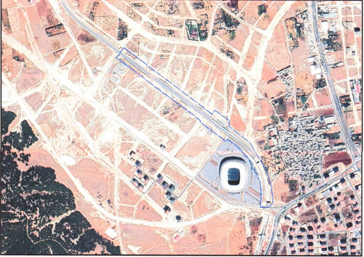
řekil 1: Gktrk Mahallesi Planlama Alanı Konumu

Plan deęiřiklięine konu alan řehitkamil İlęesi Gktrk Mahallesi sınırları ierisinde bulunmaktadır.