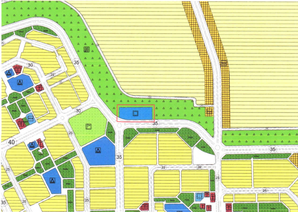
Şekil 2: Planlama Alanı Mevcut 1/5000 Ölçekli Nazım İmar Planı

Planlama alanı yürürlükteki 1/5000 ölçekli nazım imar planında Sağlık Alanı olarak görülmektedir.