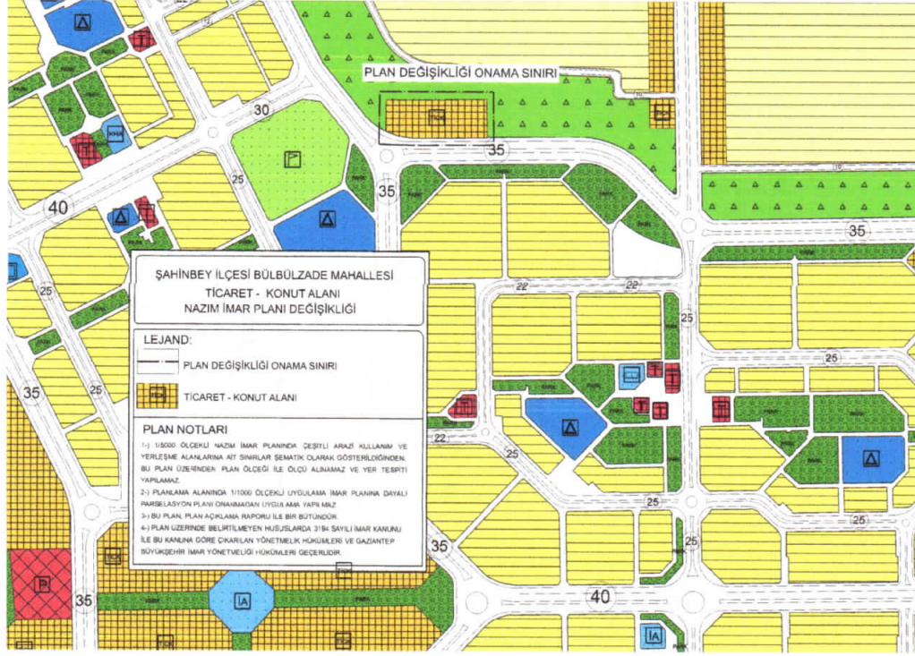
Şekil 3: Öneri 1/5000 Ölçekli Nazım İmar Planı

Bahse konu alanda imar planında ve kentsel fiziki mekanda bütünlük ve süreklilik sağlamak, yapılaşma ve kullanımlarda dil birliği ve uyumlu bir silüet yakalamak amacıyla Ticaret+konut Alanı şeklinde 1/5000 ölçekli nazım imar planı değişikliği hazırlanmıştır.