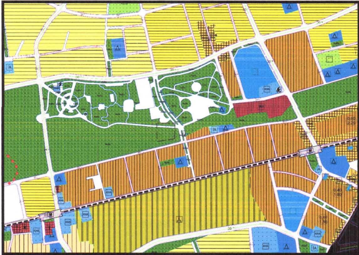
Şekil 3: Planlama Alanı Mevcut 1/5000 Uygulama İmar Planı