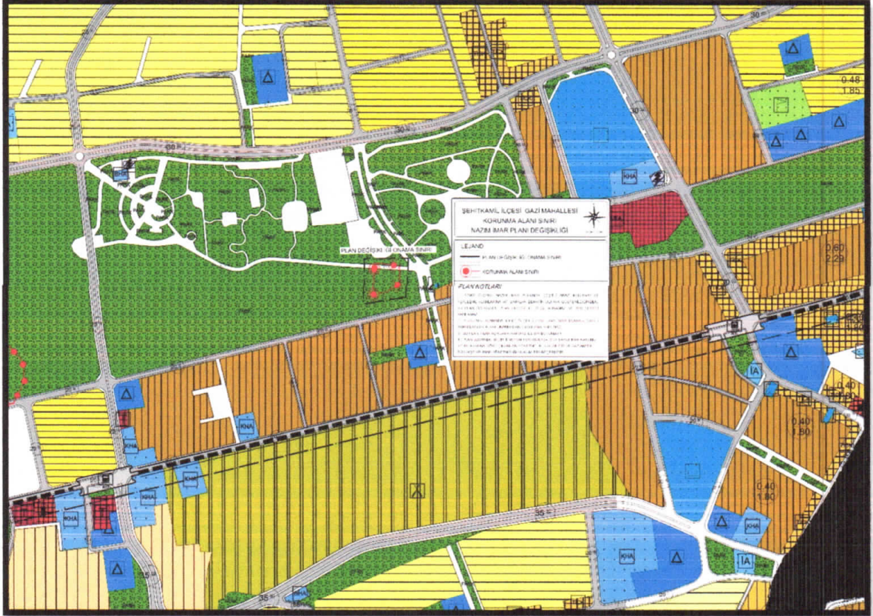
Şekil 4: Öneri 1/5000 Ölçekli Nazım İmar Planı

Şehitkâmil Gazi Mahallesi N38c-18d nazım ve N38c-18d-4a uygulama imar paftalarında bulunan alan, mevcut 1/5000 ölçekli nazım imar planında park alanı olarak görülmektedir. Söz konusu alana ilişkin Gaziantep Kültür Varlıklarını Koruma Bölge Kurulu'nun 31.07.2019 tarih ve 3378 kurul kararı ile Korunması Gerekli Taşınmaz Kültür Varlığı niteliği taşıdığı karara bağlanmıştır. Gaziantep Kültür Varlıklarını Koruma Bölge Kurulunun ilgili kararı doğrultusunda Park alanı içerisinde bulunan korunma alanı sınırının işlenmesi şeklinde 1/5000 ölçekli nazım imar planı değişikliği hazırlanmıştır.