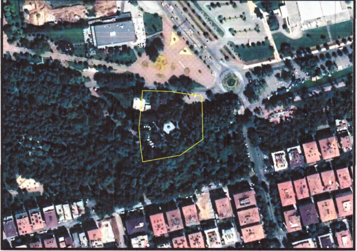
Şekil 1: Planlama Alanı Konumu

Gaziantep ili, Şehitkamil İlçesi, Gazi Mahallesi sınırları içerisinde bulunan planlama alanı, Kavaklık Caddesi üzerinde yer almaktadır.