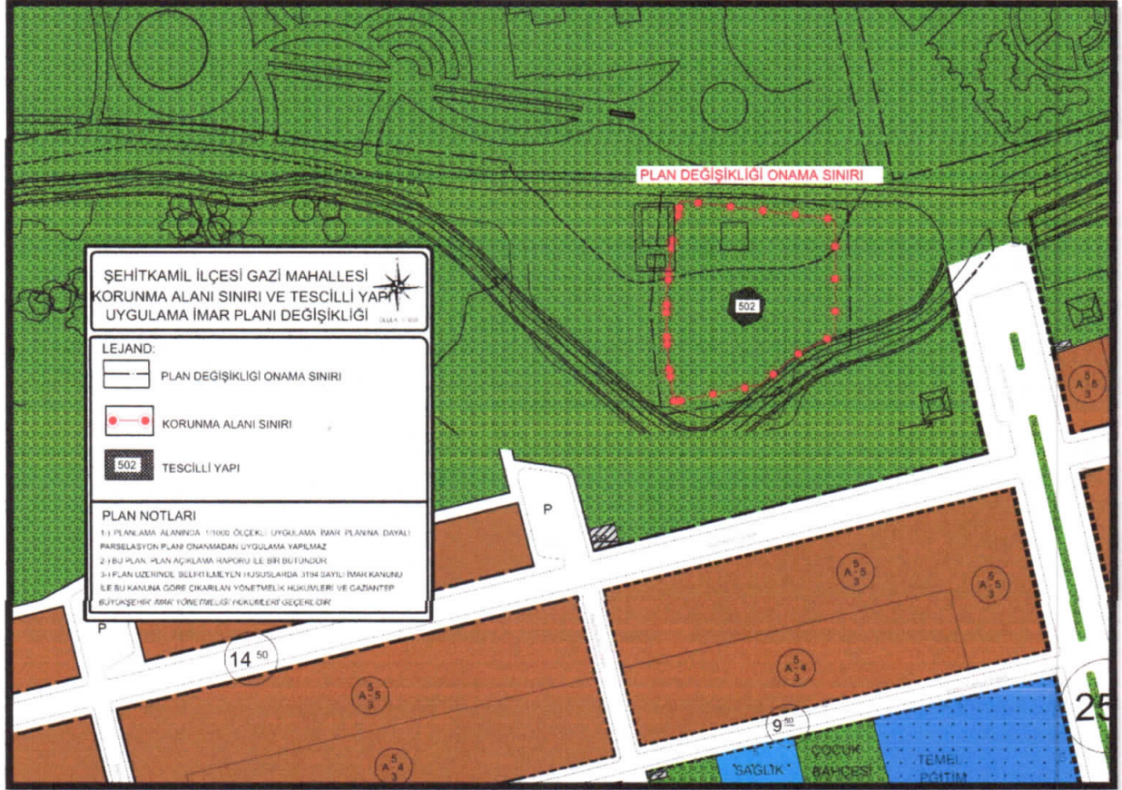
Şekil 4: Öneri 1/1000 Ölçekli Uygulama İmar Planı

Şehitkâmil Gazi Mahallesi N38c-18d nazım ve N38c-18d-4a uygulama imar paftalarında bulunan alan, mevcut 1/1000 ölçekli uygulama imar planında park alanı olarak görülmektedir. Söz konusu alana ilişkin Gaziantep Kültür Varlıklarını Koruma Bölge Kurulu'nun 31.07.2019 tarih ve 3378 kurul kararı ile Korunması Gerekli Taşınmaz Kültür Varlığı niteliği taşıdığı karara bağlanmıştır. Gaziantep Kültür Varlıklarını Koruma Bölge Kurulunun ilgili kararı doğrultusunda Park alanı içerisinde bulunan 502 envanter nolu tescilli yapının ve korunma alanı sınırının işlenmesi şeklinde 1/1000 ölçekli uygulama imar planı değişikliği hazırlanmıştır.