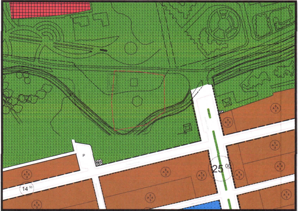
Şekil 3: Planlama Alanı Mevcut 1/1000 Uygulama İmar Planı