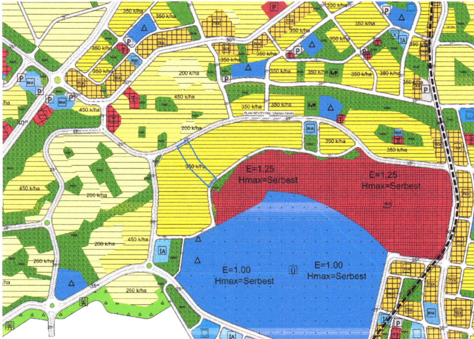
Şekil 2: Planlama Alanı Mevcut 1/5000 Nazım İmar Planı

Planlama alanı 1/5000 ölçekli nazım imar planında Yüksek Yoğunluklu Gelişme Konut Alanı olarak görülmektedir.