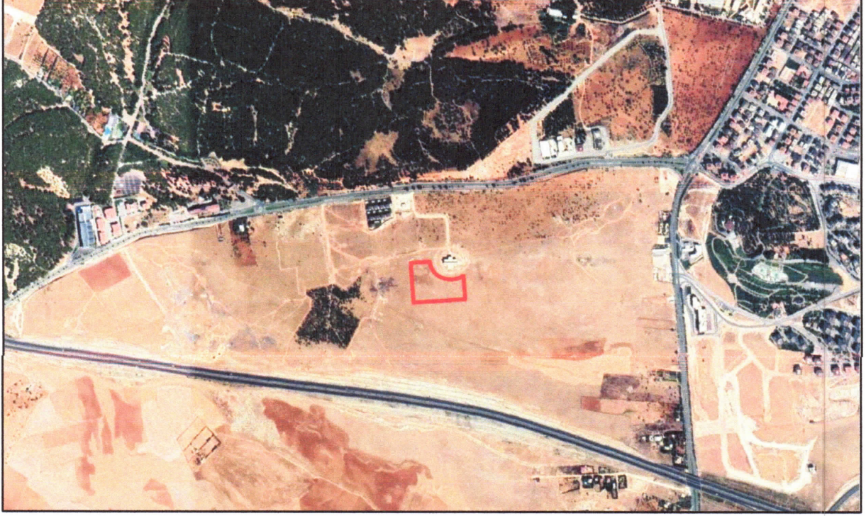
Şekil 1: Planlama Alanı Konumu (Google Earth, 2020)

Planlama alanına konu alan Şahinbey ilçesi, Kızılhisar mahallesi sınırları içerisinde yer almaktadır. Planlama alanı Burç Ormanı ve Gaziantep Üniversitesi Tekonopark Alanının güneyinde, Halep Bulvarının batısında, Gaziantep Çevre Yolunun kuzeyinde yer almaktadır.