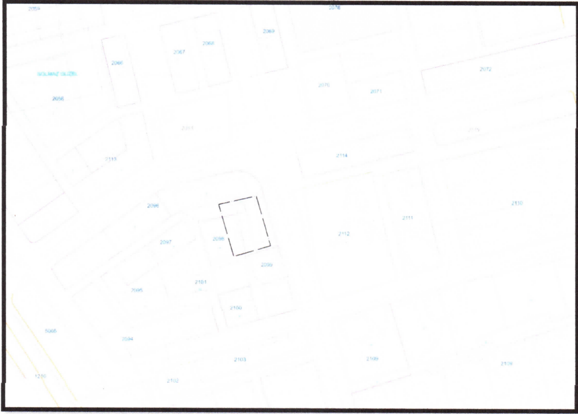
Şekil 2: Halihazır ve Kadastral Durum