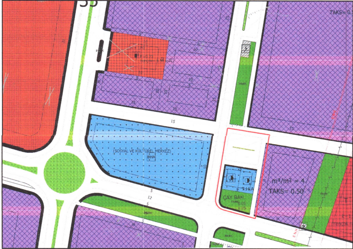
Şekil 2: Planlama Alanının Mevcut 1/1000 Ölçekli uygulama İmar Planındaki Durumu

Bahse konu alan Mevcut 1/1000 ölçekli uygulama imar planında otopark alanı, resmi kurum alanları, yol ve park alanı olarak planladığı görülmektedir.