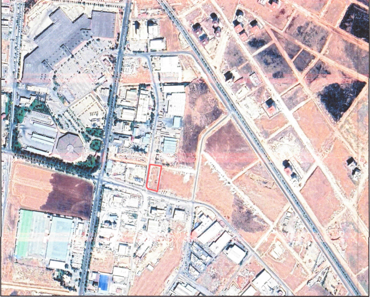
řekil 1: Planlama Alanının Konumu

Planlama deęiřiklięine konu alan řhitkamil ilęesi aydınlr mahallesi sınırları ięerisinde D-850 karayolunun batısında, Bahattin Nakioęlu Caddesinin doęusunda ve 3040. Caddenin kuzeyinde yer almaktadır.