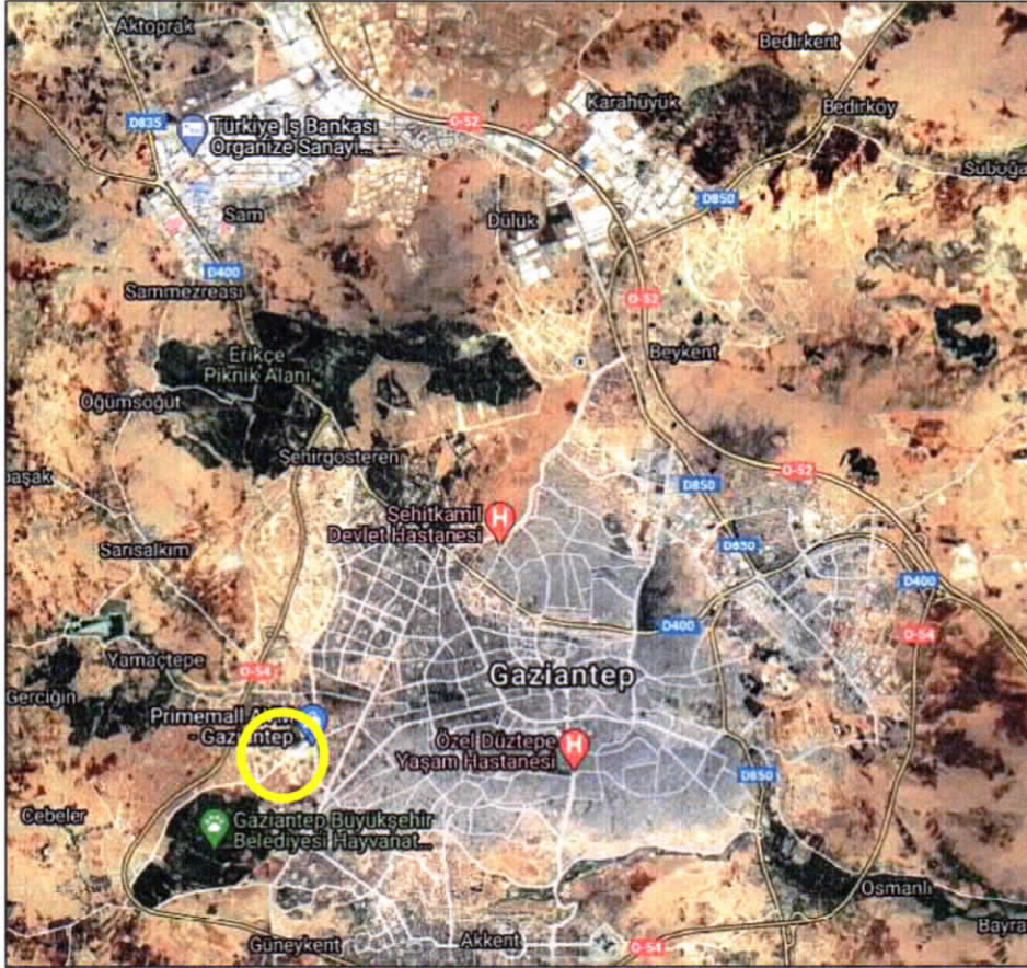
Hava Fotoğrafı-Çalışma Alanının Gaziantep Merkezindeki Konumu

Yakın çevresi olarak kuzey doğusunda Gaziantep Çocuk Hastanesi, doğusunda Gaziantep Polis Evi, Çevik Kuvvet Şube Müdürlüğü ve İstanbul Gaziantep'liler Anadolu Lisesi bulunmaktadır.