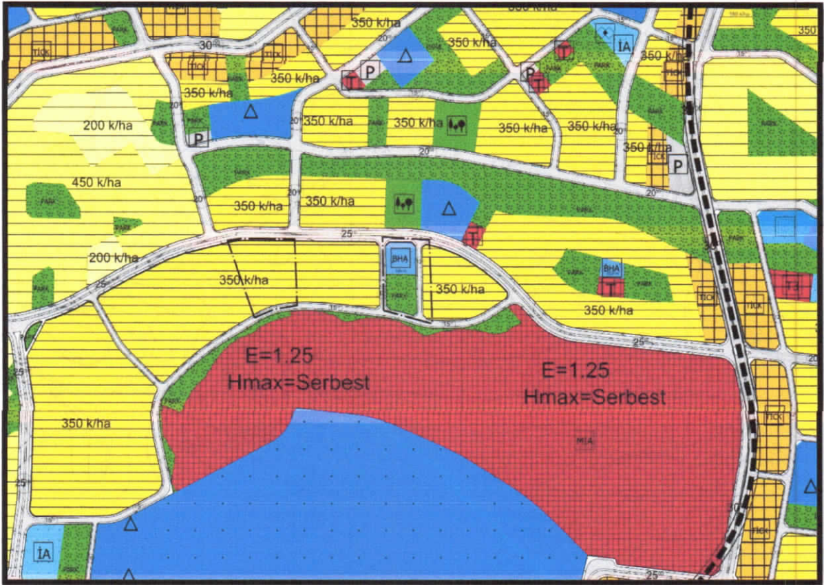
Şekil 3: Planlama Alanı Mevcut 1/5000 Ölçekli Nazım İmar Planı