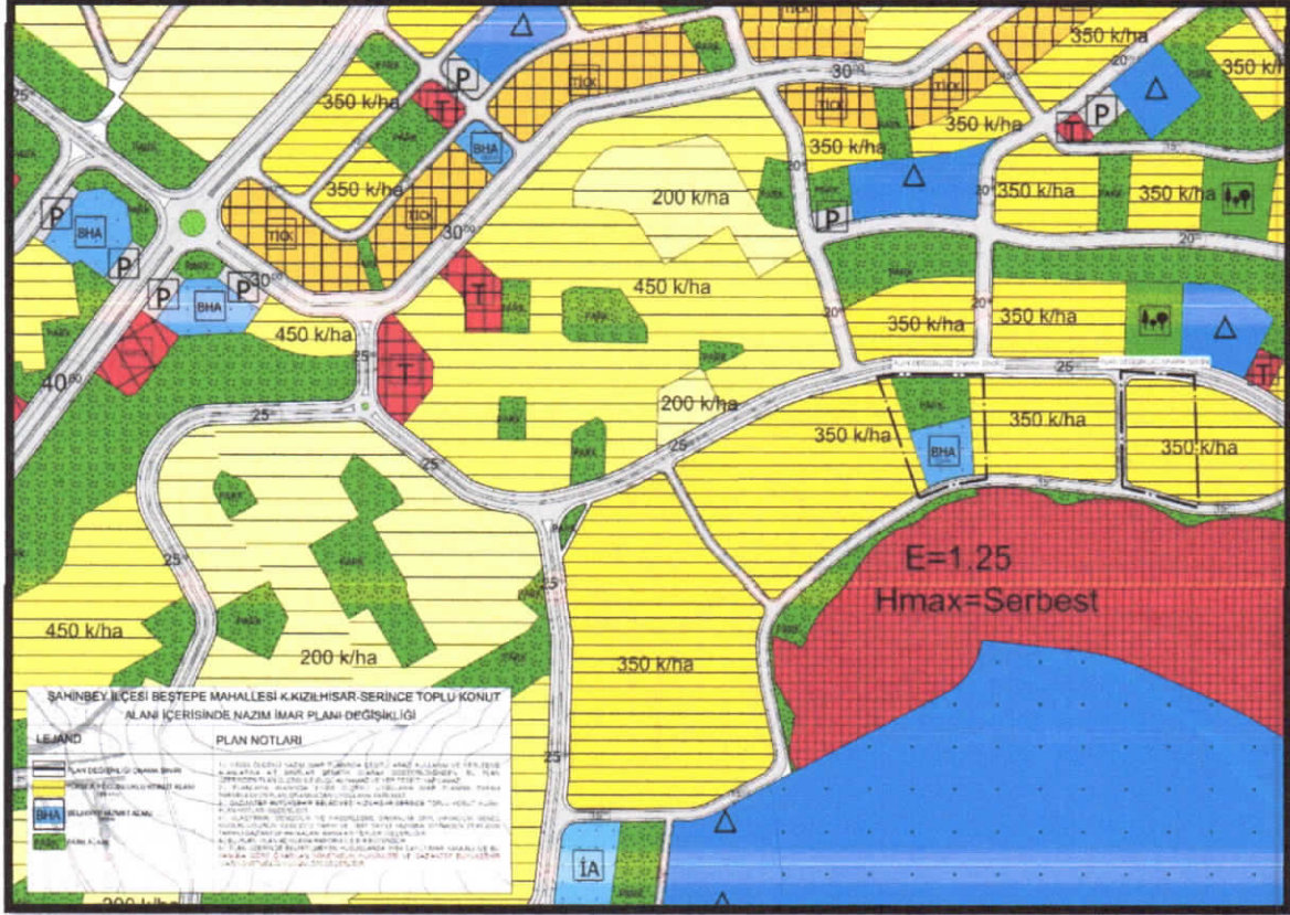
Şekil 4: Planlama Alanı Öneri 1/5000 Ölçekli Nazım İmar Planı

Söz konusu bölgede modern, sürdürülebilir bir planlama bölgesi oluşturmak, sosyal donatı dengesini yeniden düzenleyerek alandaki ihtiyaçları karşılamak amacıyla çevresindeki mevcut plan ve yapılaşmaya uygun olarak mekânsal bütünlük ve sürekliliği sağlamak amacıyla hazırlanan konut alanı, büyükşehir belediye hizmet alanı ve park alanı şeklinde 1/5000 ölçekli nazım imar planı değişikliği hazırlanmıştır.