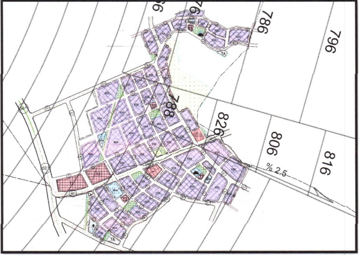
Şekil 6: Öneri 1/1000 Ölçekli Uygulama İmar Planı