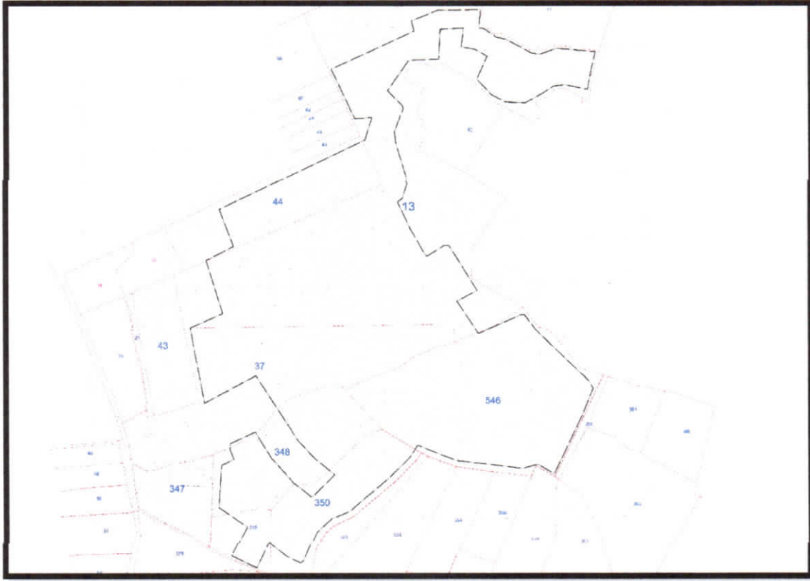
Şekil 2: Halihazır ve Kadastral Durum