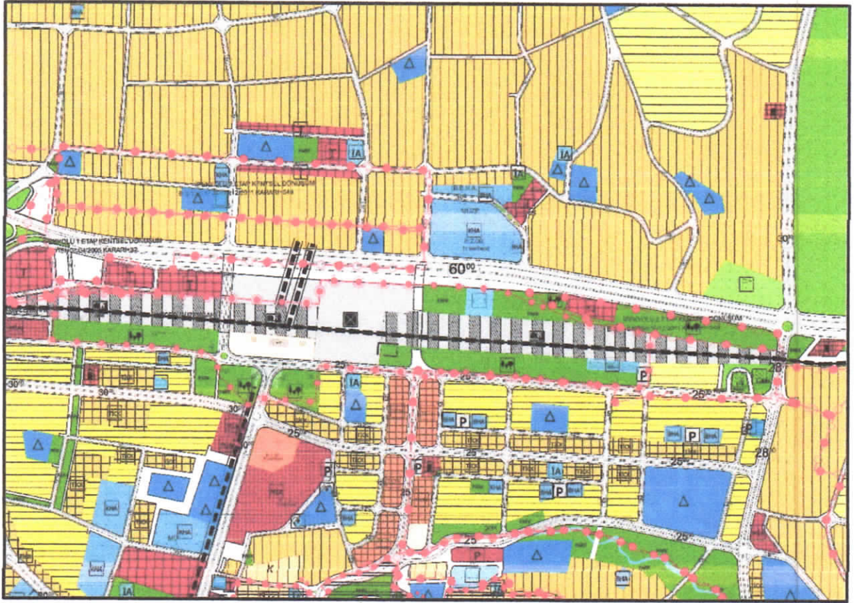
Şekil 3: Planlama Alanı Mevcut 1/5000 Nazım İmar Planı