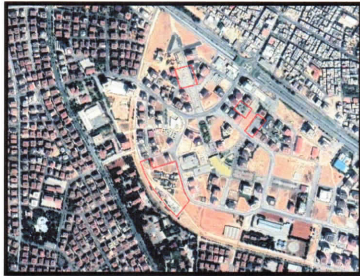
Alanın Uydu Görüntüsü

Plan değişikliğine konu olan alanlar Mücahitler Mahallesi N38-C4 ve N38c-18a paftalarında bulunan alan Şehitkamil Kültür Merkezi'nin güneyinde, batısında ve kuzeyinde bulunmaktadır.