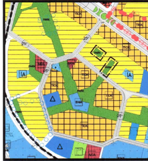
1/5.000 Ölçekli Öneri Nazım İmar Planı