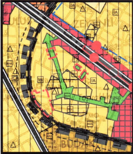
1/25.000 Ölçekli Öneri Nazım İmar Planı

Söz konusu bölge içerisinde bölge halkının yeşil alan ihtiyacının karşılanabilmesi amacıyla değişikliğe konu alanın park alanı ve artan nüfusun konut ihtiyacının karşılanabilmesi amacıyla konut alanı olarak planlanması suretiyle 1/25.000 ve 1/5.000 ölçekli nazım imar planı değişikliği hazırlanmıştır.