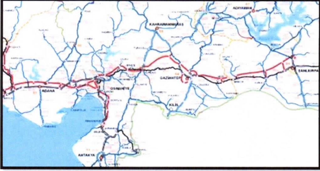
Gaziantep İli Karayolu Bağlantıları

Gaziantep, tarihi İpek Yolu üzerinde olmasından dolayı yüzyıllar boyu önemli bir ulaşım ve ticaret odağı olmuştur. Geçmişten gelen ulaşım odağı olma rolünü günümüzde de sürdürmektedir. Hem demiryolu hem karayolu bağlantılarıyla güneyden Akdeniz'e, batıya ve kuzeye giden yolların kavşak noktasında bulunmaktadır. Kent sınırları içinden geçen E-90 ve D-400 karayolları bölgenin en önemli ulaşım akslarıdır.