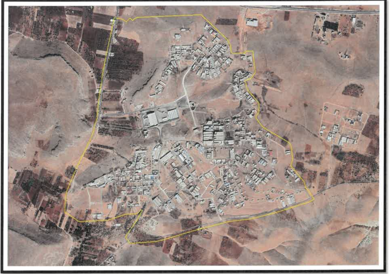
Şekil 1: Planlama Alanı Konumu

Nazım imar planı deęişikliğine konu alan, Şehitkamil İlçesi Sinan Mahallesi ve Oğuzeli İlçesi, Çaybaşı mahallesi sınırları içerisinde yer almaktadır.