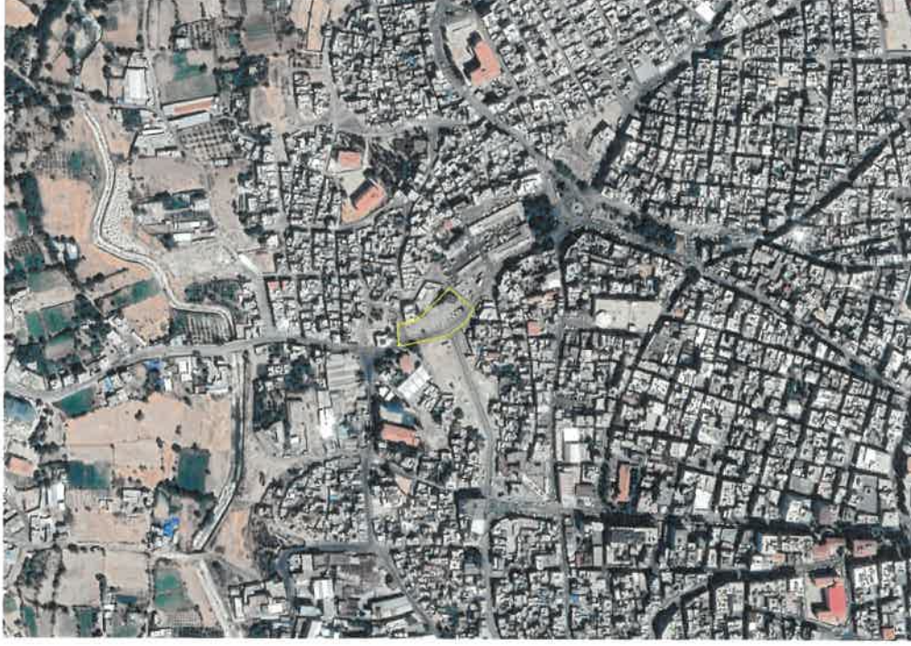
Şekil 1: Planlama Alanı Konumu

Gaziantep ili, Nizip İlçesi, Fevkani Mahallesi sınırları içerisinde yer alan planlama alanı Bahçe Sokak üzerinde yer almaktadır.