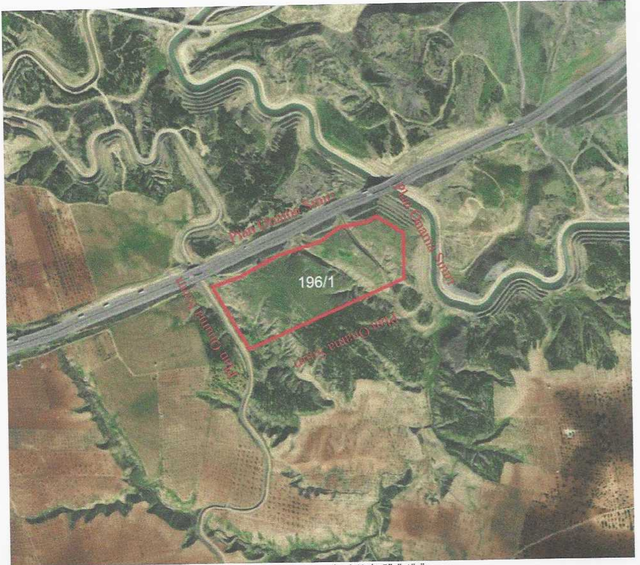
196 Ada 1 Nolu Parsel Ait Uydu Görüntüsü

İmar planına konu alan, Gaziantep ili ile Nizip ilçesi kent merkezlerinin doğusunda yer almakta olup, Gaziantep kent merkezine yaklaşık 52 km, Nizip kent merkezine ise yaklaşık 10 km uzaklıktadır. Gaziantep İli, Nizip İlçesi, Kavunlu Mahallesi sınırları içerisinde, mülkiyeti maliye hazinesine ait, ham toprak vasıflı 196 ada 1 nolu parsel üzerinde yaklaşık 9,8 ha büyüklüğündeki alanı kapsamaktadır.