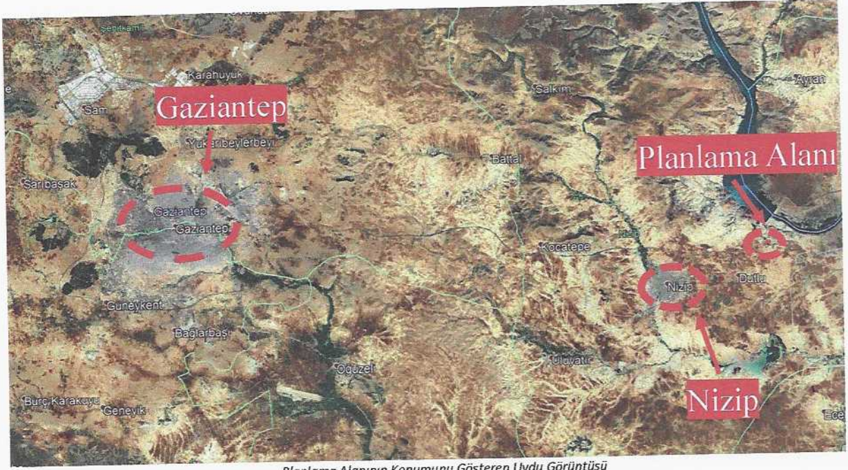
Planlama Alanının Konumunu Gösteren Uydu Görüntüsü