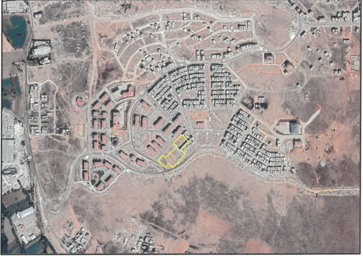
Şekil 1: Malazgirt Mahallesi Planlama Alanı Konumu

Planlama alanı Gaziantep ili, Şahinbey İlçesi, Malazgirt Mahallesi sınırları içerisinde yer almaktadır.