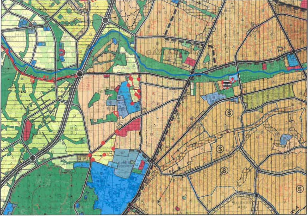
Şekil 3: Planlama Alanı Mevcut 1/25.000 Nazım İmar Planı