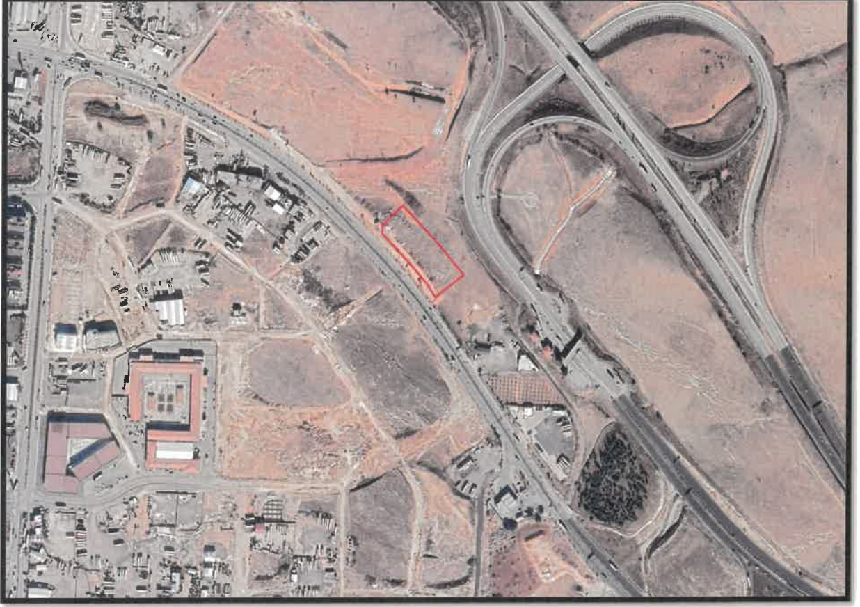
Şekil 1: Planlama Alanı Konumu

Söz konusu planlama alanı Gaziantep ili, Şehitkamil İlçesi, Sanayi Mahallesi içerisinde bulunmaktadır.