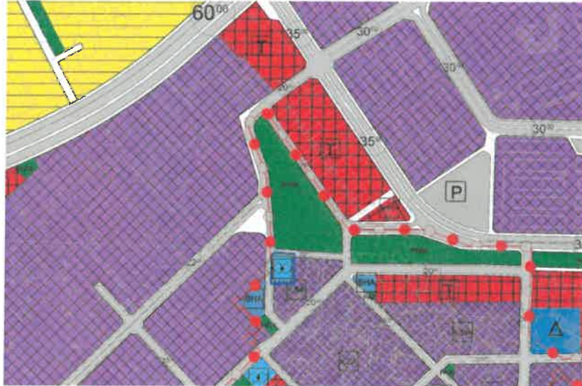
Şekil 3: Mevcut 1/5000 Ölçekli Nazım İmar Planı

Planlama alanı mevcut 1/5.000 ölçekli nazım imar planında sosyal tesis alanı olarak görülmektedir.