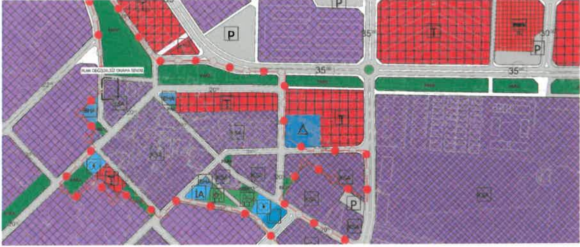
Şekil 4: Öneri 1/5000 Ölçekli Nazım İmar Planı