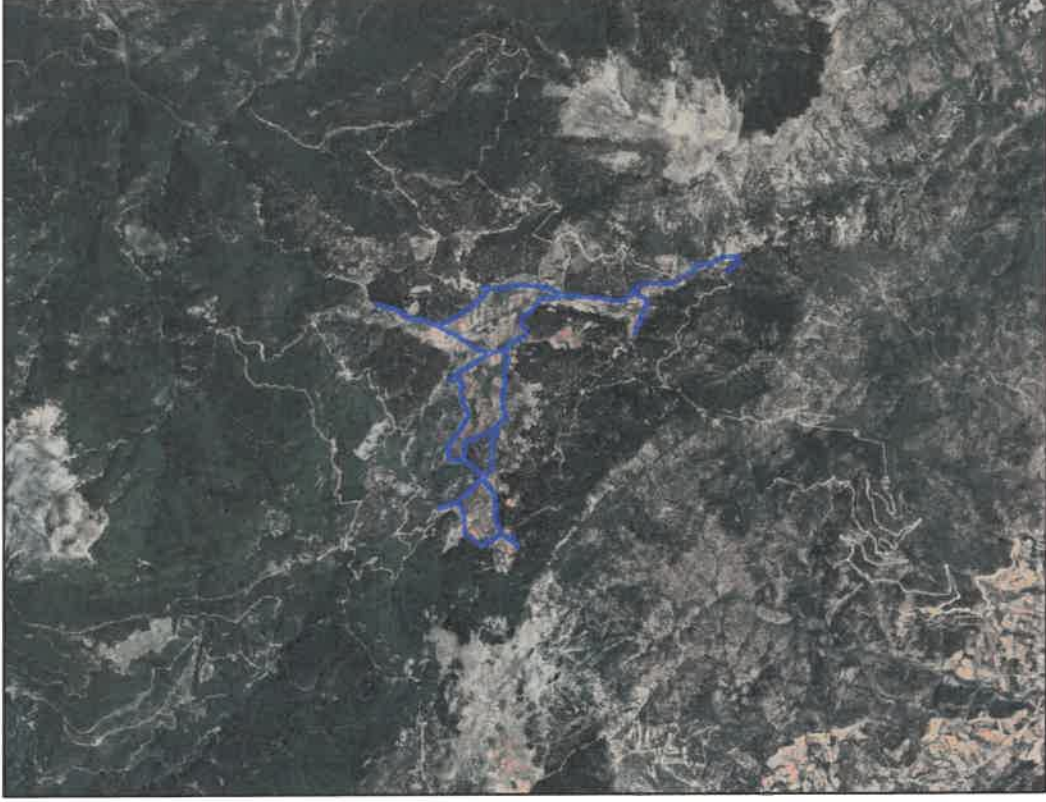
Şekil 1: Planlama Alanının Konumu

Planlama alanı İslahiye ilçesi Tandır Mahallesi sınırları içerisinde yer almaktadır. Planlama alanının kuzeyinde ve batısında Osmaniye ilçesi, doğusunda tandır mahallesi bulunmaktadır.