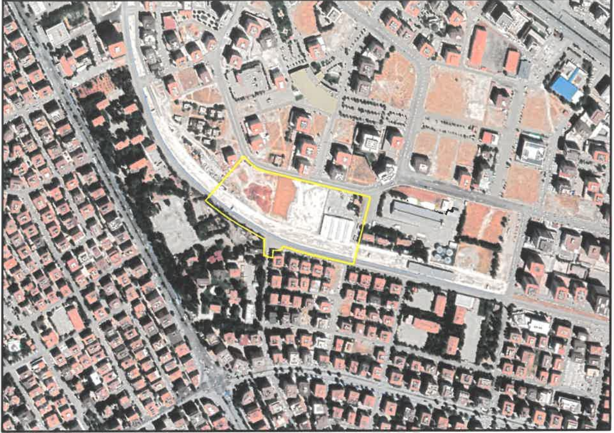
Şekil 1: Planlama Alanı Konumu

Plan deęişikliğine konu alan Gaziantep ili, Şahinbey İlçesi Mücahitler Mahallesi sınırları içerisinde bulunmaktadır.