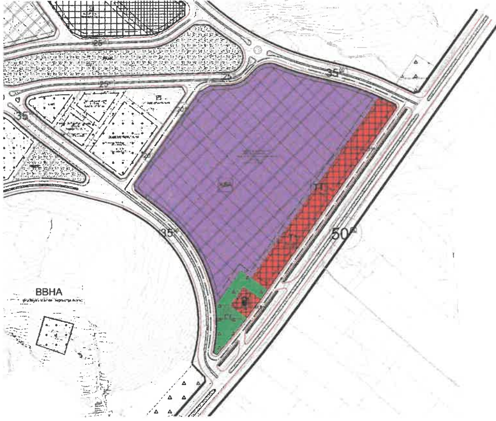
Şekil 3: Öneri 1/1000 Ölçekli Uygulama İmar Planı

Bahse konu alanda imar planı revizyon çalışması ile küçük sanayi alanı, ticaret alanı, akaryakıt+lpg satış ve servis istasyonu alanı ve ağaçlandırılacak alan şeklinde düzenlenmiştir.