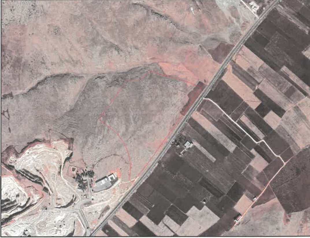
Şekil 1: Planlama Alanının Konumu

Planlama alanı Bedirkent mahalle sınırları içerisinde Araban-Yavuzeli yolunun kuzeydoğusunda yer almaktadır.