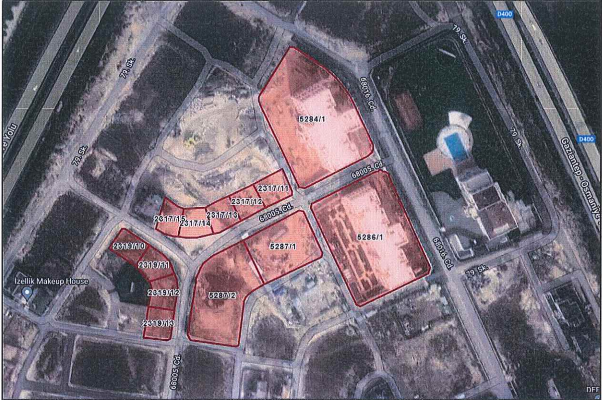
Plan Onama Sınırı Civarında Kadastral Tescil (Ölçeksizdir)

Taşınmazlar Gaziantep ili metropoliten merkezinin kuzey batısında, Gaziantep-Osmaniye-Adana Karayolunun (D-400) batı kıyısında ve Gaziantep Çevre Yolunun güney doğusunda yer almaktadır. Planlama alanının kuzeyinde 1950'li yıllardan başlayarak ağaçlandırılmış orman alanları ve orman alanlarının içerisinde; parklar, piknik alanları, mesire ve kamp alanları bulunmaktadır. Planlama alanı, Gaziantep şehir merkezine yaklaşık 8,7 km, otagara yaklaşık 10,3 km ve havaalanına yaklaşık 30,4 km uzaklıktadır.