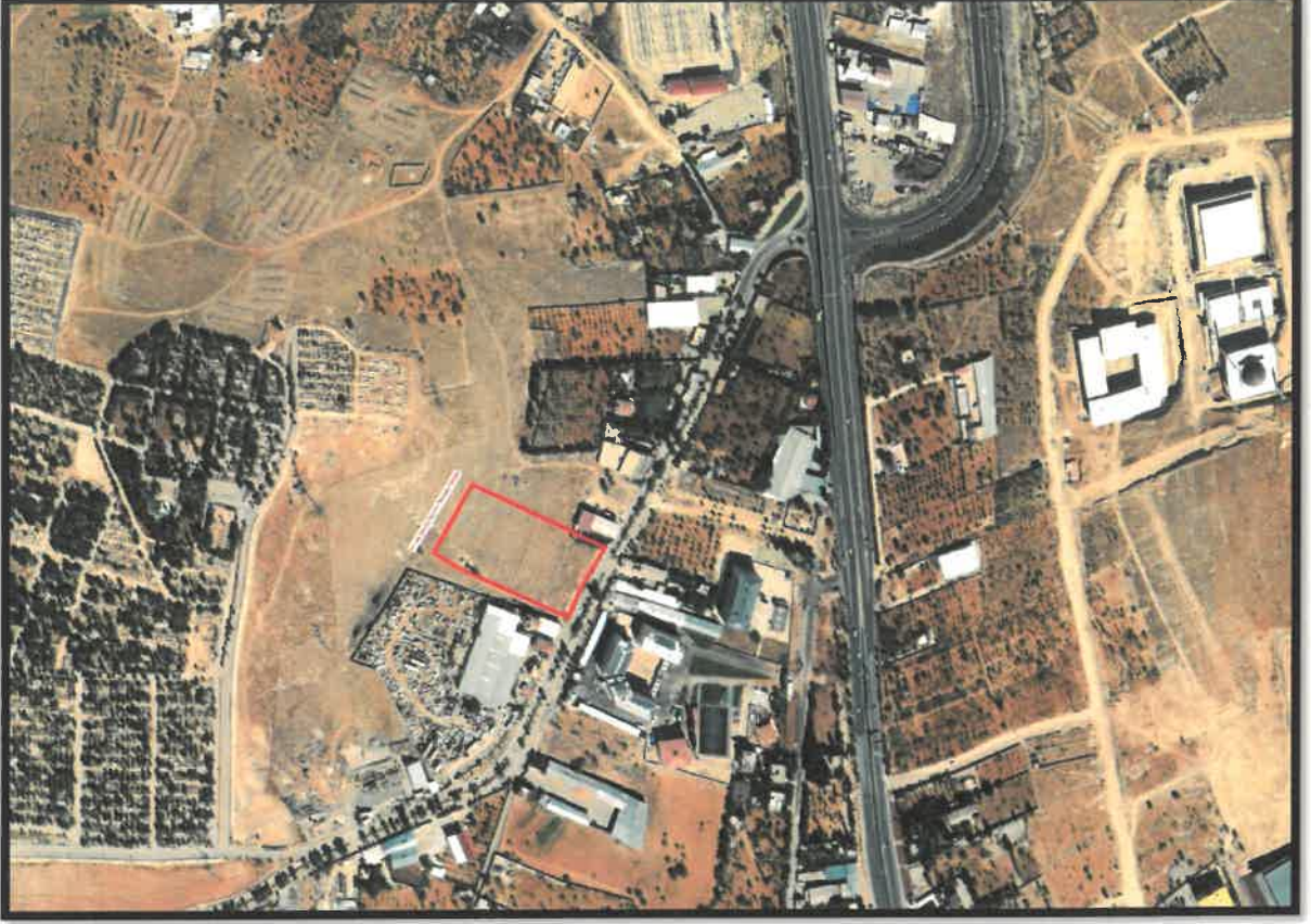
Şekil 1: Planlama Alanı Konumu

Planlama alanı Şahinbey İlçesi, Yeşilkent Mahallesi sınırları içerisinde yer almaktadır. Bahse konu alan kent için önemli ulaşım arterleri olan Gaziantep Çevre Yolunun güneyinde, D850 karayolunun batısında yer almaktadır.