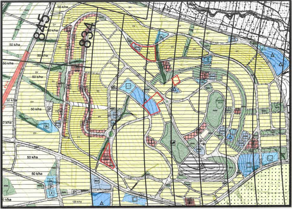
Şekil 2: Planlama Alanı Mevcut 1/5000 Ölçekli Nazım İmar Planı