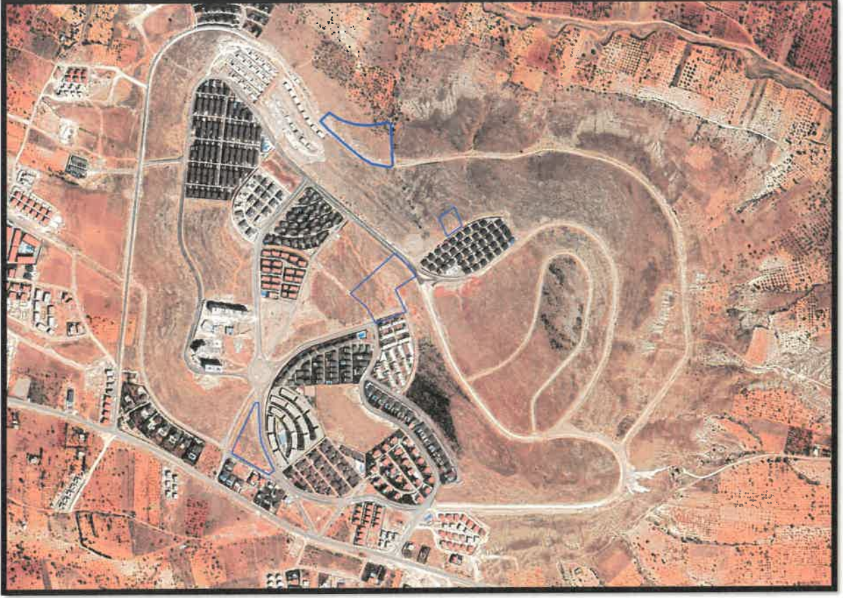
 ekil 1: Planlama Alanı Konumu

Planlama alanı Oğuzeli İlçesi, K rk n Mahallesi sınırları i erisinde yer almaktadır.