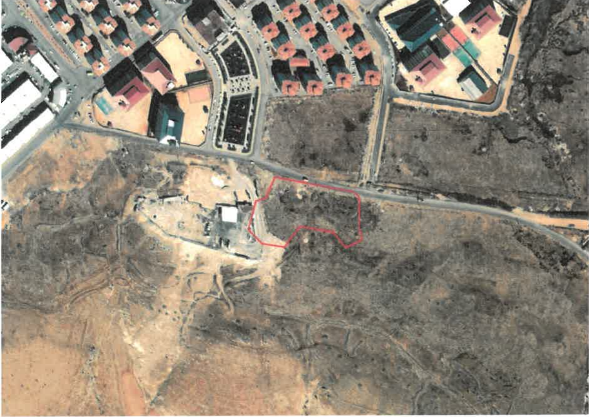
Şekil 1: Planlama Alanı Konumu

Gaziantep ili, Şahinbey İlçesi, Bağlarbaşı Mahallesi sınırları içerisinde bulunan planlama alanı, Gaziantep Çevre Yolu'nun güneyinde, Mavikent Sanayi Sitesi'nin güneydoğusunda yer almaktadır.