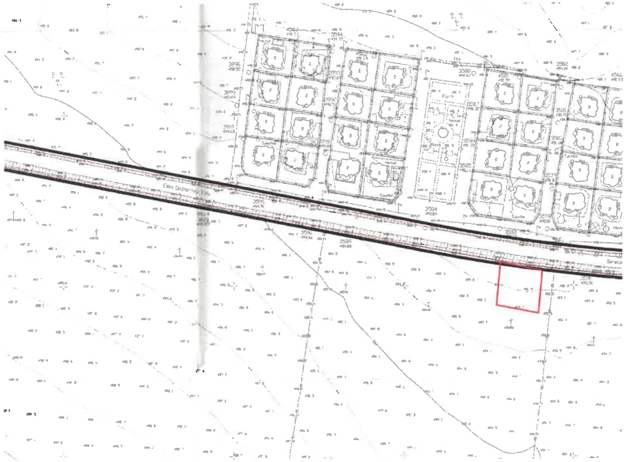
Şekil 2: Planlama Alanı Mevcut 1/5000 Ölçekli Nazım İmar Planı

Plan değişikliğine konu alan, mevcut 1/5000 Ölçekli Nazım İmar Planında plansız alan olarak görülmektedir.