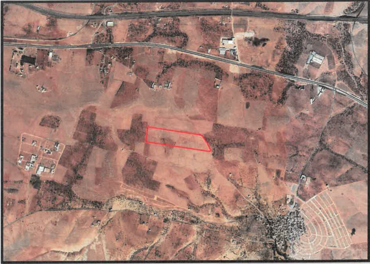
Şekil 1: Planlama Alanı Konumu

Planlama alanı Şehitkâmil İlçesi, Sinan Mahallesi sınırları içerisinde yer almaktadır.