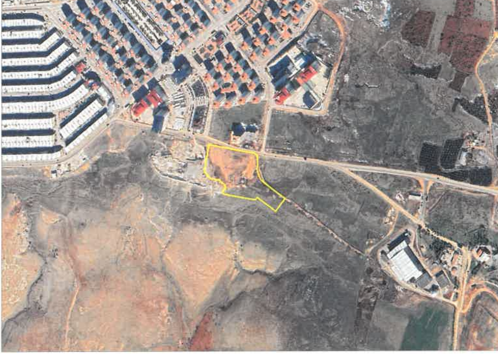
Şekil 1: Planlama Alanı Konumu

Gaziantep İli, Şahinbey İlçesi, Bağlarbaşı Mahallesi sınırları içerisinde bulunan planlama alanı, Gaziantep Çevre Yolu' nun güneyinde, Mavikent Sanayi Sitesi' nin güneydoğusunda yer almaktadır.