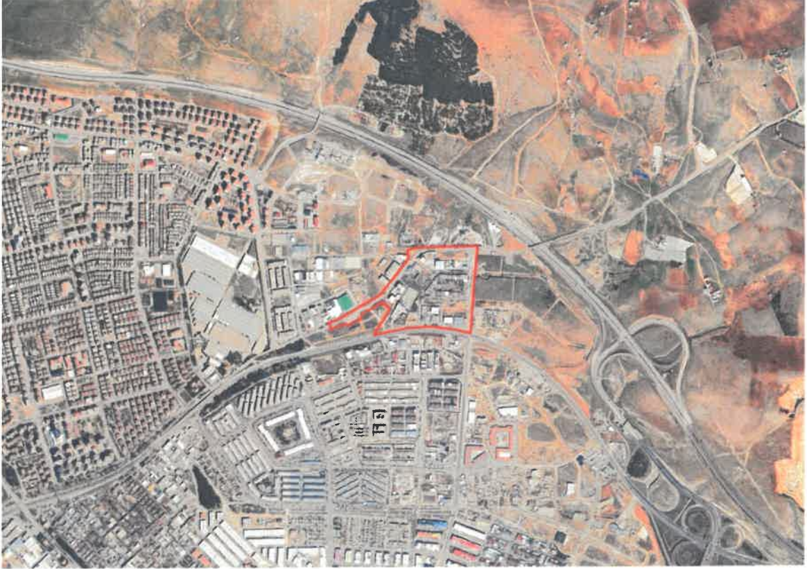
Şekil 1: Planlama Alanının Konumu

Planlama alanı Şehitkamil İlçesi, Burak mahallesi sınırları içerisinde Saikonukoğlu Bulvarının ve GATEM'İN kuzeyinde, Adana-Şanlıurfa TEM Otoyolunun güneybatısında yer almaktadır.