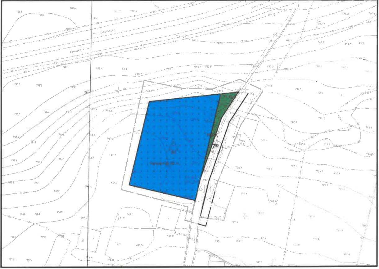
Şekil 3: Planlama Alanı Öneri 1/1000 Uygulama İmar Planı