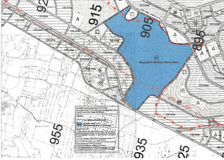
Şekil 5: Öneri 1/5000 Ölçekli Nazım İmar Planı