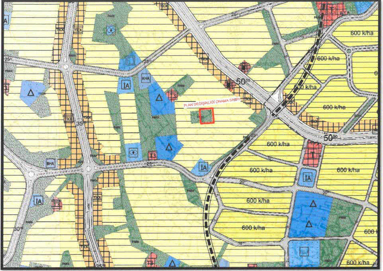
Şekil 2: Planlama Alanı Mevcut 1/5000 Ölçekli Nazım İmar Planı