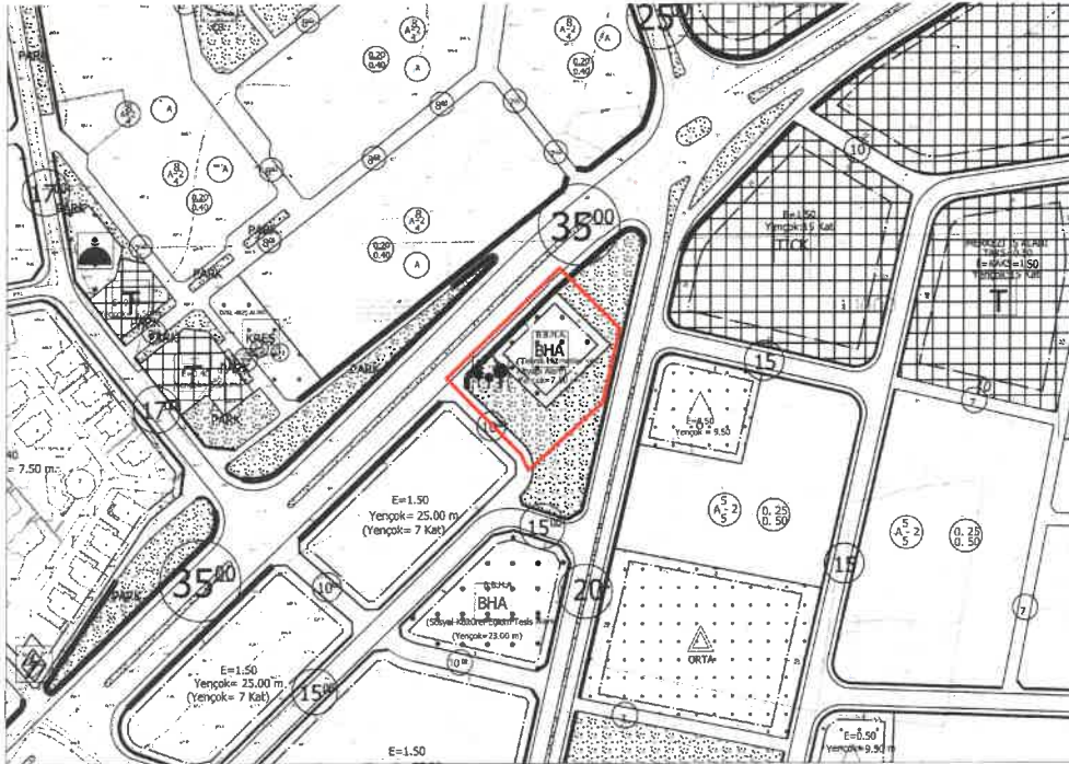
Şekil 2: Planlama Alanı Mevcut 1/1000 Ölçekli Uygulama İmar Planı

Plan değişikliğine konu alan mevcut 1/1000 ölçekli uygulama imar planında rekreasyon alanı ve büyükşehir belediye hizmet alanı (Teknik Hizmetler ve Altyapı Alanı, Yençok:7.50 m) olarak görülmektedir.