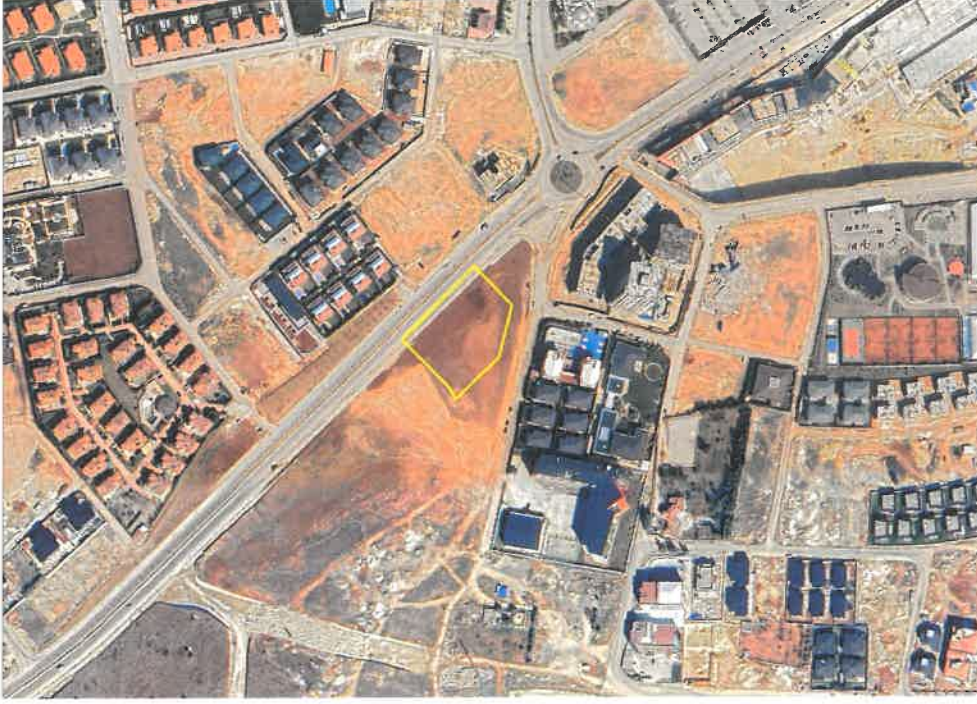
Şekil 1: Planlama Alanı Konumu

Planlama alanı; Gaziantep İli, Şehitkâmil İlçesi, 15 Temmuz Mahallesi Büyükşehir Belediyesi Mahraman Kentsel Dönüşüm ve Gelişim Proje Alan Sınırları içerisinde yer almakta 56022 numaralı cadde üzerinde bulunmaktadır.