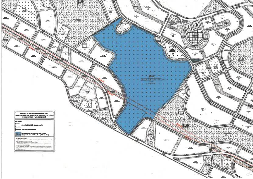
Şekil 3: Planlama Alanı Öneri 1/1000 Ölçekli Uygulama İmar Planı

Plan değişikliğine konu bölgede belediye hizmetlerinin daha etkin, verimli ve sürdürülebilir sağlanması amacıyla Büyükşehir Belediye Hizmet Alanı (Dış Birimler, Teknik Hizmetler ve Altyapı Alanı) (E:1.20, Yençok:8 kat) düzenlenmesi ile hazırlanan uygulama imar planı değişikliği ile ilgili düzenleme 'Mekânsal Planlar Yapım Yönetmeliği' gösterim tekniğine uygun olarak hazırlanmıştır.