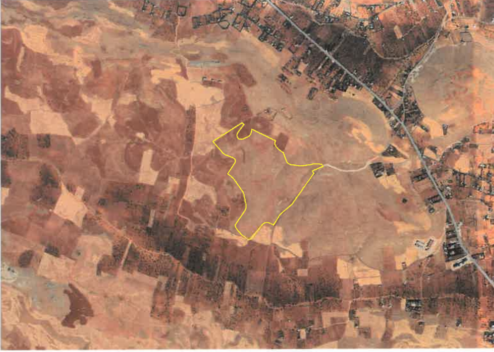
Şekil 1: Planlama Alanı Konumu

Planlama alanı; Gaziantep İli, Şahinbey İlçesi, Bağlarbaşı Mahallesi sınırları içerisinde, Halep Bulvarı' nın güneybatısında yer almaktadır.