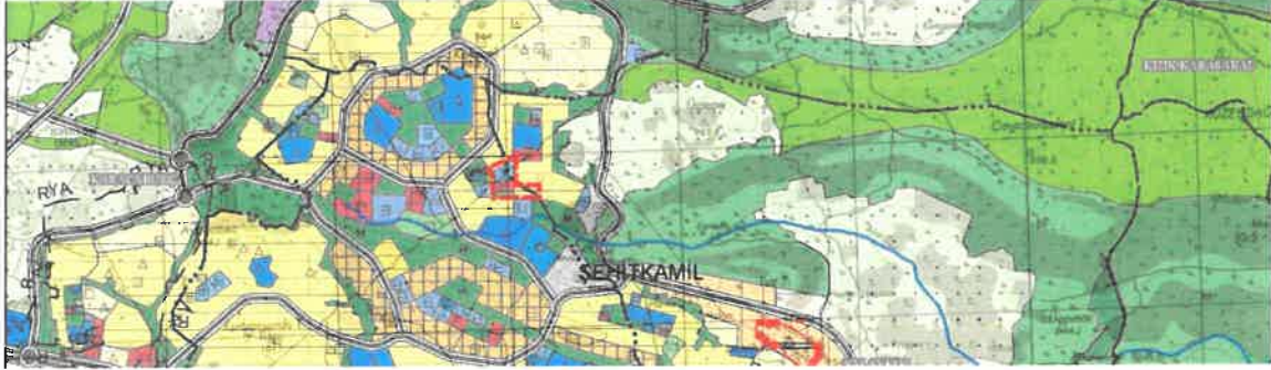
Şekil 2: Mevcut 1/25000 Ölçekli Nazım İmar Planı

Planlama alanı mevcut 1/25.000 ölçekli nazım imar planında sosyal tesis, park, konut ve ticaret alanı olarak görülmektedir.