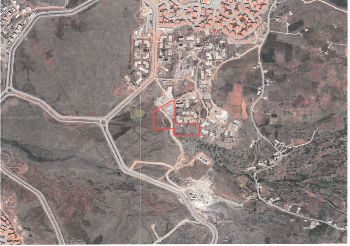
Şekil 1: Planlama Alanının Konumu

Planlama alanı Şhitkamil İlçesi, Yalangöz Mahallesi sınırları içerisinde Kuzeyşehir 6.Etap Bölgesinin güneyinde yer almaktadır.