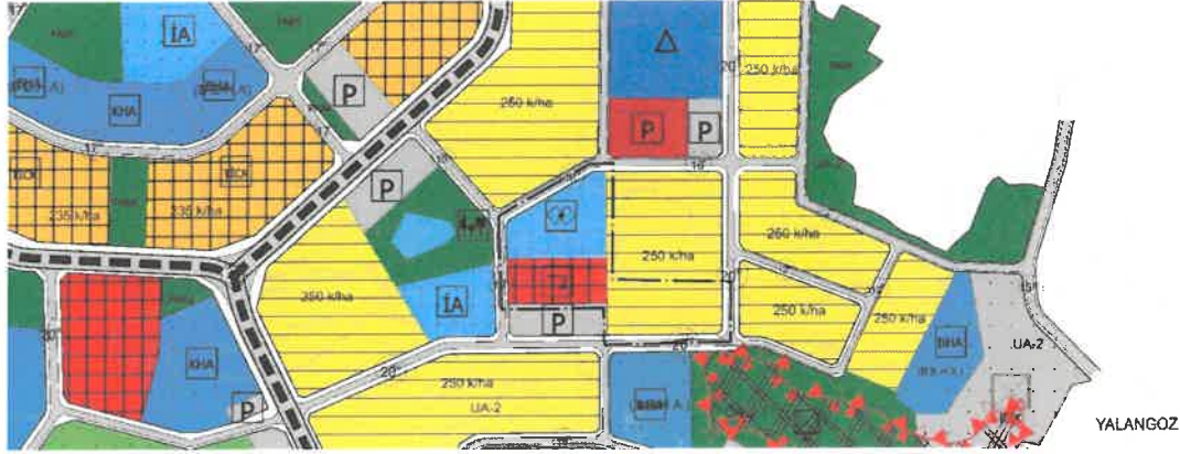
Şekil 3: Mevcut 1/5000 Ölçekli Nazım İmar Planı

Planlama alanı mevcut 1/5.000 ölçekli nazım imar planında sosyal tesis, konut ve ticaret olarak görülmektedir.