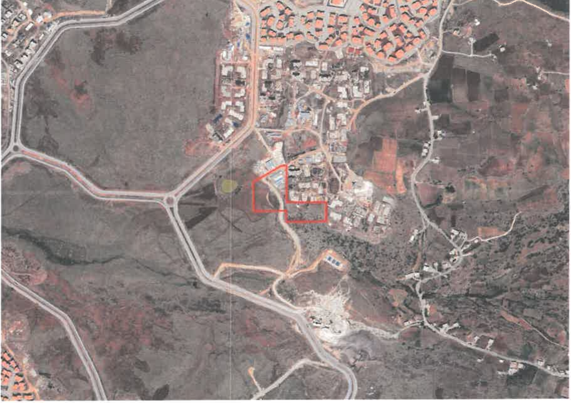
Şekil 1: Planlama Alanının Konumu

Planlama alanı Şhitkamil İlçesi, Yalangöz Mahallesi sınırları içerisinde Kuzeyşehir 6.Etap Bölgesinin güneyinde yer almaktadır.