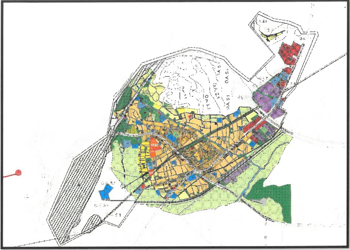
Şekil 2: Mevcut 1/5000 Ölçekli Nazım İmar Planı