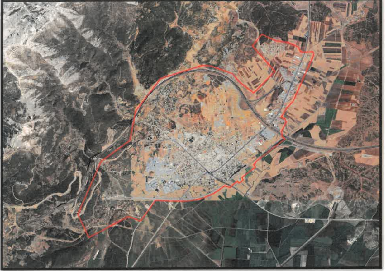
Şekil 1: Planlama Alanının Konumu

Planlama alanı İslahiye İlçesi Fevzipaşa yerleşiminin kuzeydoğusunda, Nurdağı İlçesi Gözlühöyük yerleşiminin ise kuzeybatısında yer almaktadır. Planlama alanı Nurdağı İlçe Merkezinde yer alan; Başpınar, Kurudere, M.Akif Ersoy, Fatih, Yeni, Atatürk, Yavuzelim, Aslanlı, Esenyurt, Bahçelievler, Bademli, Alpaslan Türkeş Mahalleleri sınırlarında yer almaktadır.