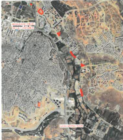
Şekil_2: Planlama alanının konumu.

Plan değişikliğine konu alan, Gaziantep ili, Şahinbey İlçesi Yeşilkent ve Şehitkamil İlçesi 29 Ekim Mahalleleri sınırları içerisinde Abdulkadir Yüksel Devlet Hastanesi ile GASKİ Arıtma Tesisleri arasında yer almaktadır.