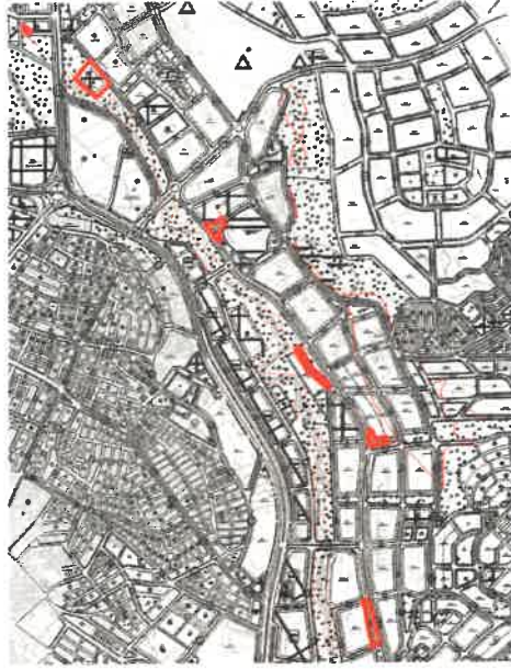
Şekil_3: Mevcut 1/1000 ölçekli uygulama imar planı durumu

Şahinbey İlçesi Yeşilkent ve Şehitkamil İlçesi 29 Ekim Mahallelerinde plan değişikliğine konu alanlar mevcut imar planında konut, ticaret+konut, merkezi iş alanı, ticaret ve eğitim tesis alanı olarak görülmektedir.