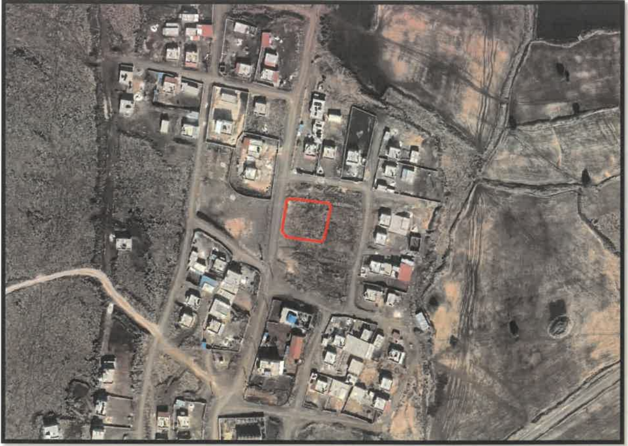
Őekil 1: Planlama Alanı Konumu

Plan deęişikliğine konu alan Yavuzeli İlçesi Aşağıh c kl  Mahallesi sınırları i erisinde bulunmaktadır.