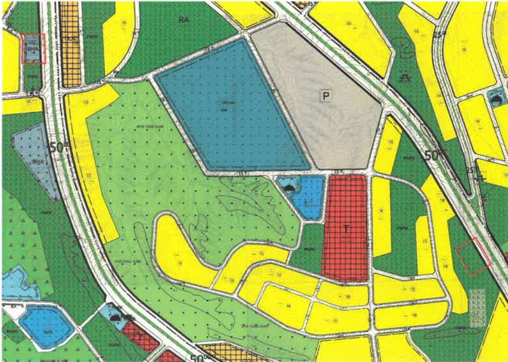
Şekil 2: Planlama Alanı Mevcut 1/1000 Ölçekli Uygulama İmar Planı

Plan değişikliğine konu alanlar mevcut 1/1000 ölçekli uygulama imar planında Büyükşehir Belediye Hizmet Alanı (İtfaiye) ve Park Alanı olarak görülmektedir.