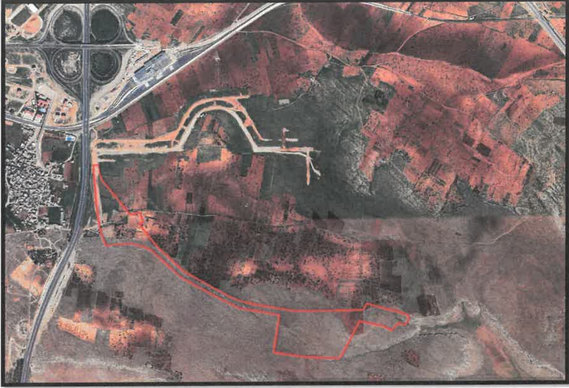
Şekil 1: Şehitkamil İlçesi Taşlıca Mahallesi ve Şahinbey İlçesi Bayramlı Mahalleleri Planlama Alanı Konumu

Söz konusu planlama alanları Gaziantep İli, Şehitkamil İlçesi Taşlıca Mahallesi ve Şahinbey İlçesi Bayramlı Mahalleleri içerisinde bulunmaktadır.