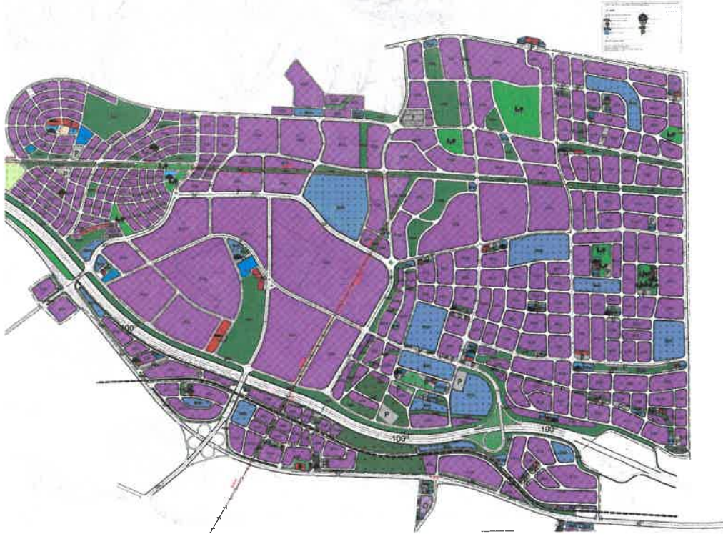
Şekil_4: Öneri 1/1000 Ölçekli İlave Revizyon Uygulama İmar Planı durumu