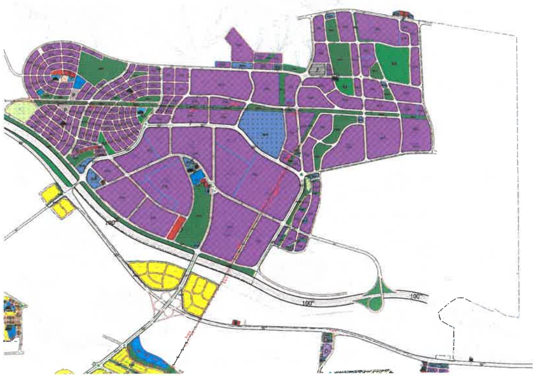
Şekil_3: Mevcut 1/1000 Ölçekli Uygulama İmar Planı durumu

Şehitkâmil İlçesi Taşlıca, Küllü Mahallesi, Şahinbey İlçesi Bayramlı Mahallesi ve Oğuzeli İlçesi Çaybaşı Mahallesi sınırları içerisinde Büyükşehir Belediyesi BUSEM I ve BUSEM II Kentsel Dönüşüm ve Gelişim Proje Alan Sınırı içerisindeki alan, mevcut 1/1000 ölçekli uygulama imar planında konut alanı, imar yolları ve büyük çoğunluğu plansız olarak görülmektedir.