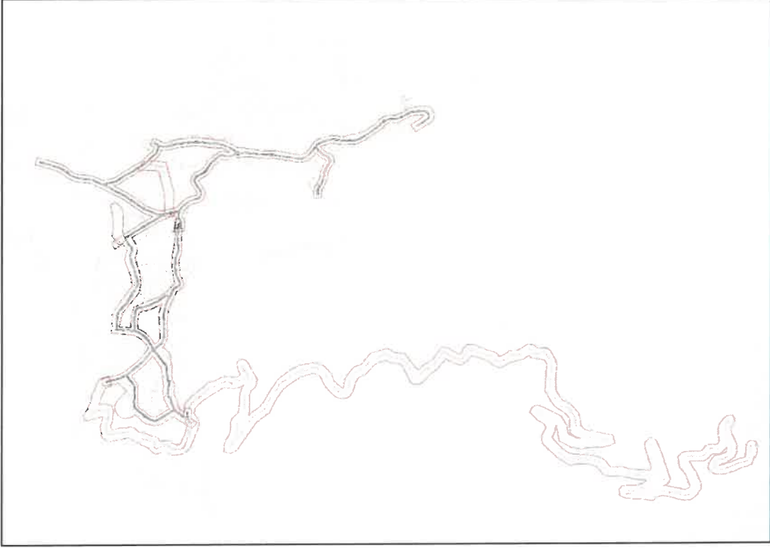
Şekil 2: Mevcut 1/5000 Ölçekli Nazım İmar Planı

Planlama alanı mevcut 1/5000 ölçekli nazım imar planında imar yolu ve plansız alan olarak görülmektedir.