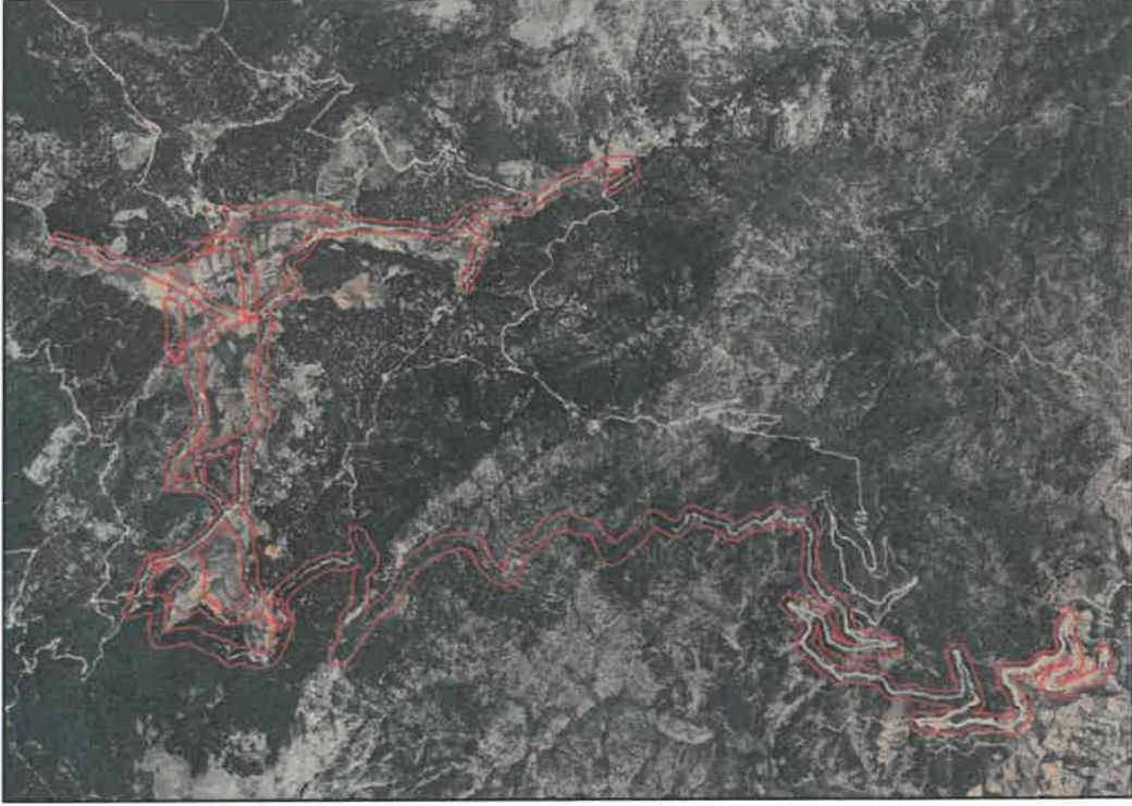
Şekil 1: Planlama Alanının Konumu

Planlama alanı İslahiye ilçesi Tandır ve Yağızlar Mahallesi sınırları içerisinde yer almaktadır. Planlama alanının kuzeyinde ve batısında Osmaniye ilçesi, doğusunda İdilli mahallesi bulunmaktadır.