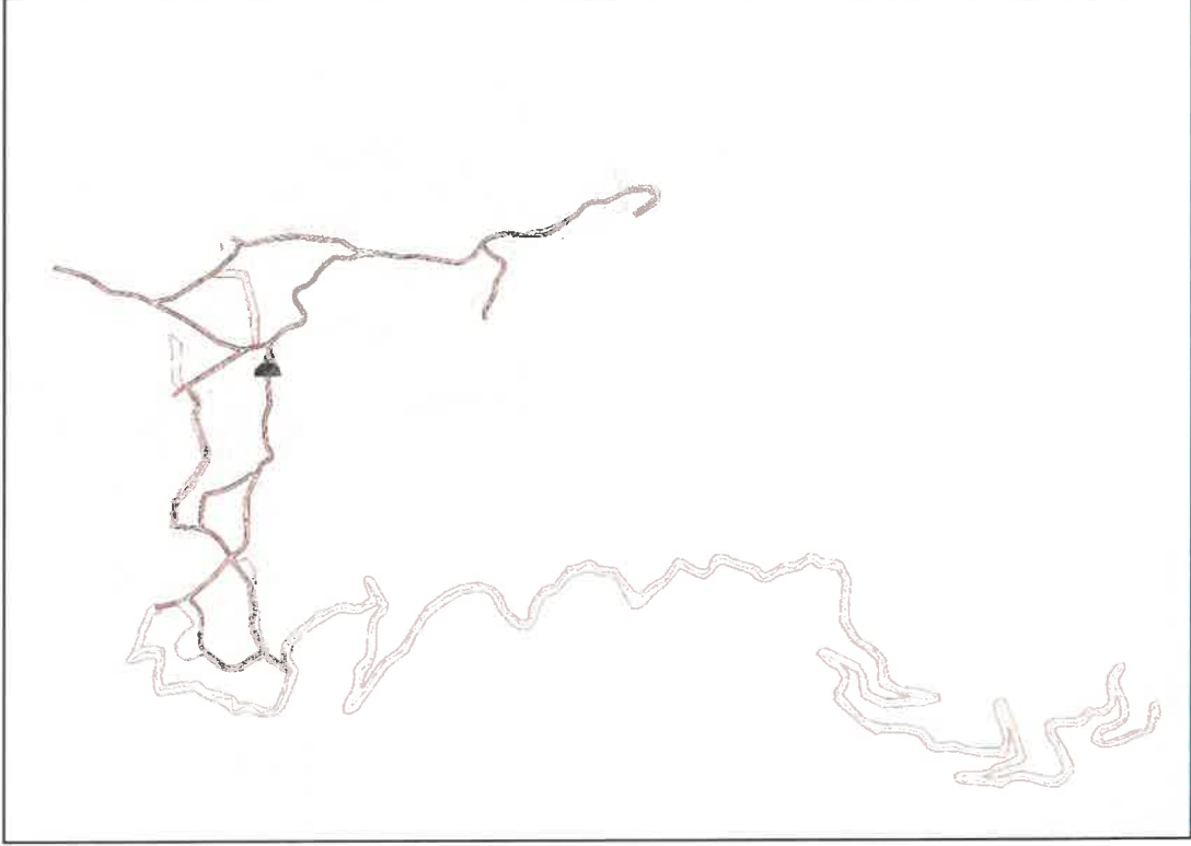
Şekil 2: Mevcut 1/1000 Ölçekli uygulama İmar Planı

Planlama alanı mevcut 1/1000 ölçekli uygulama imar planında imar yolu ve plansız alan olarak görülmektedir.