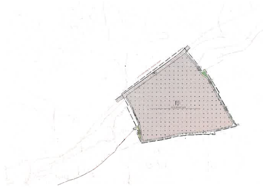
Şekil 5: Öneri 1/5000 Ölçekli Nazım İmar Planı