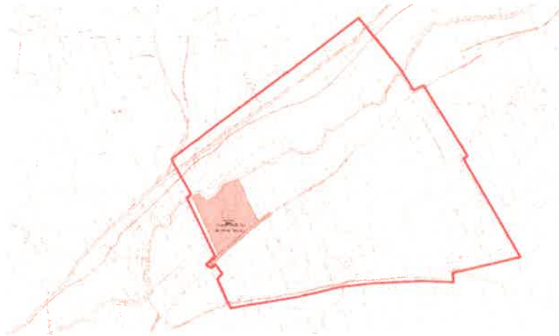
Şekil 3: Mevcut 1/5000 Ölçekli Nazım İmar Planı

Planlama alanı mevcut 1/5.000 ölçekli nazım imar planında kısmen teknik altyapı alanı ve plansız alan olarak görülmektedir.