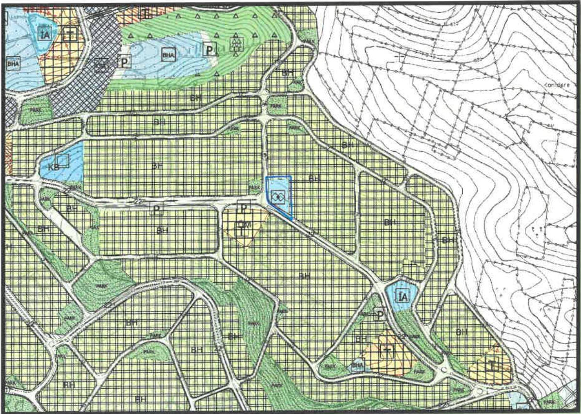
Şekil 3: Planlama Alanı Mevcut 1/5.000 Ölçekli Nazım İmar Planı